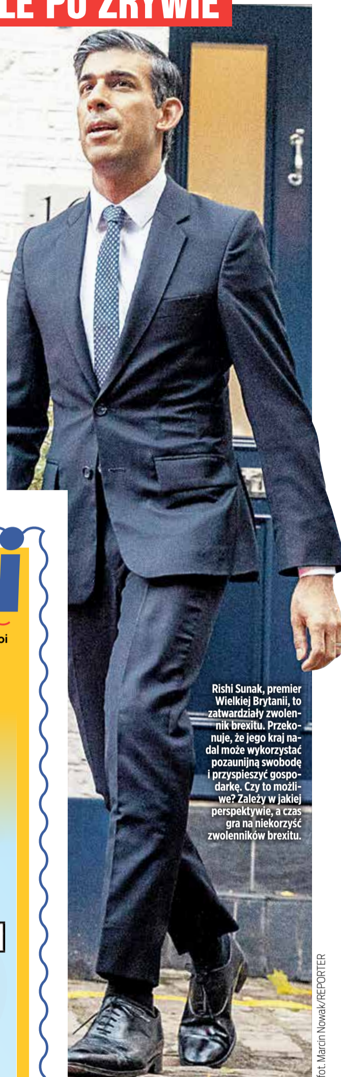
Rishi Sunak, premier Wielkiej Brytanii, to zatwardziały zwolennik brexitu. Przekonuje, że jego kraj nadal może wykorzystać pozaukładową swobodę i przyspieszyć gospodarkę. Czy to możliwe? Zależy w jakiej perspektywie, a czas gra na niekorzyść zwolenników brexitu.

Albo Wielka Brytania wyjdzie z kryzysu, albo jej obywatelom skończy się cierpliwość!