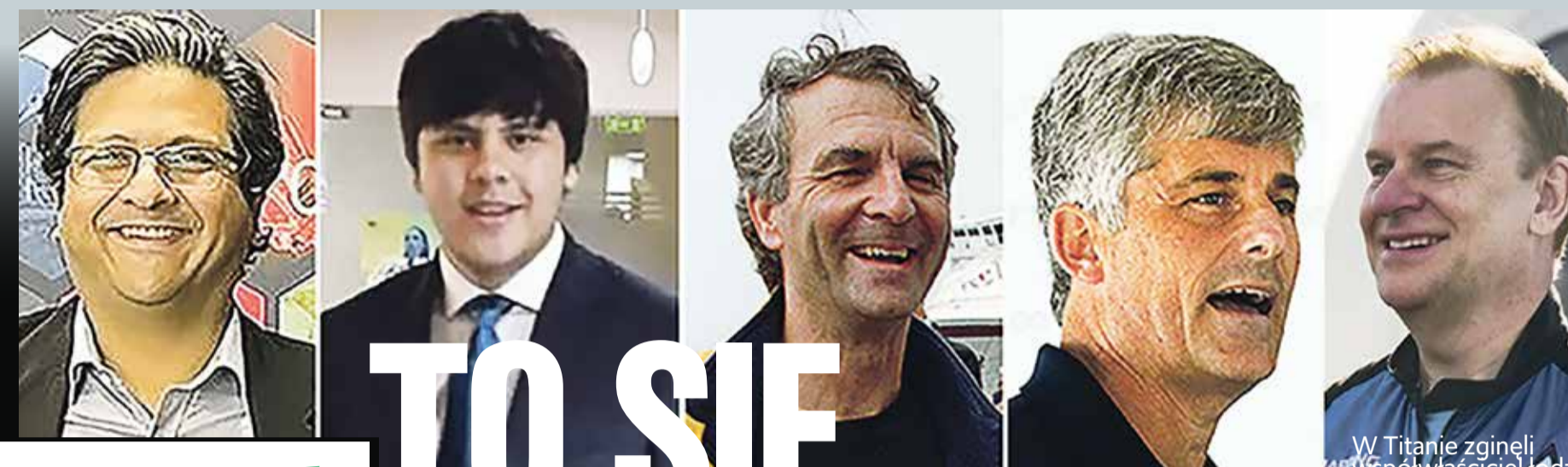
W Titanie zgineli współwłaściciel i dziódzi czterech pasażerów