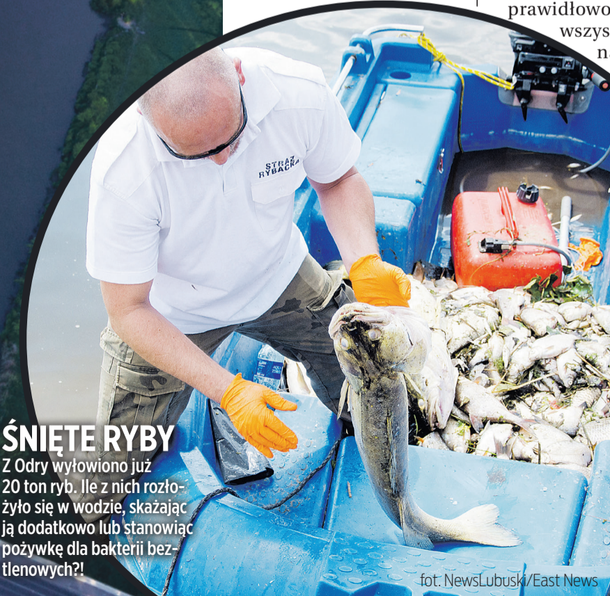
ŚNIĘTE RYBY Z Odry wylowiono już 20 ton ryb. Ile z nich rozłożyło się w wodzie, skażając ją dodatkowo lub stanowiąc pożywkę dla bakterii beztlenowych?